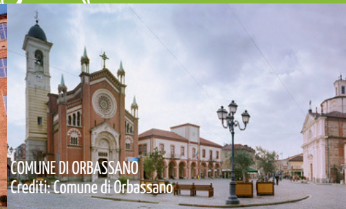
COMUNE DI ORBASSANO