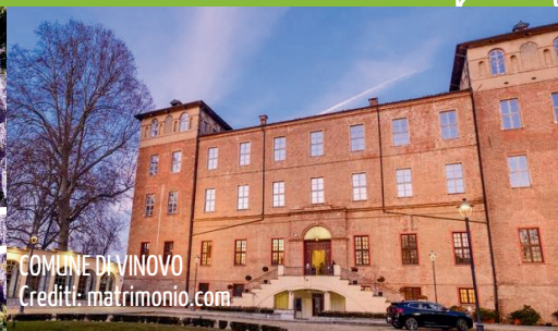
COMUNE DI VINOVO