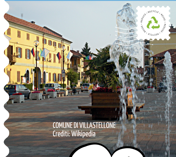
COMUNE DI VILLASTELLONE

PER MAGGIORI INFORMAZIONI CONSULTA "IL REGOLAMENTO DEI CENTRI DI RACCOLTA" SU WWW.COVAR14 O CHIAMA IL NUMERO VERDE CONSORTILE 800.639.639