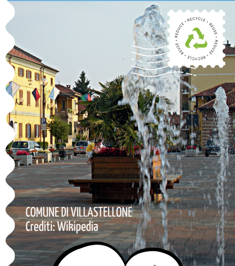
COMUNE DI VILLASTELLONE

PER MAGGIORI INFORMAZIONI CONSULTA "IL REGOLAMENTO DEI CENTRI DI RACCOLTA" SU WWW.COVAR14 O CHIAMA IL NUMERO VERDE CONSORTILE 800.639.639