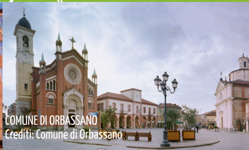
COMUNE DI ORBASSANO