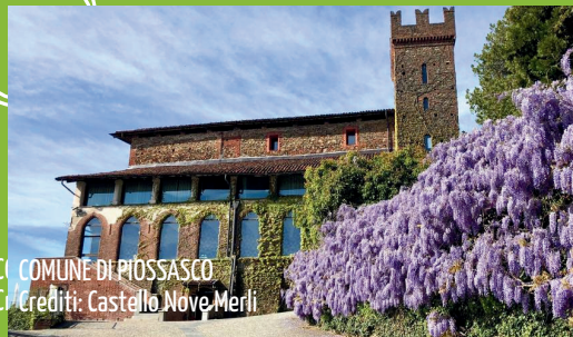
COMUNE DI PIOSASCO Credito: Castello Nove Merli

UN NUOVO APPROCCIO ALL'ECONOMIA CIRCOLARE, PER RENDERE ANCORA PIÙ BELLE E PULITE LE NOSTRE CITTÀ!