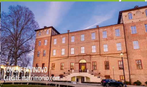
COMUNE DI VINOVO