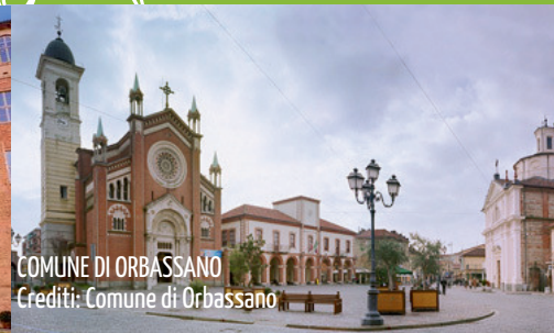
COMUNE DI ORBASSANO