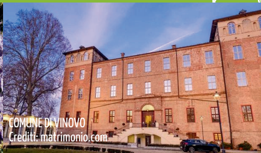
COMUNE DI VINOVO