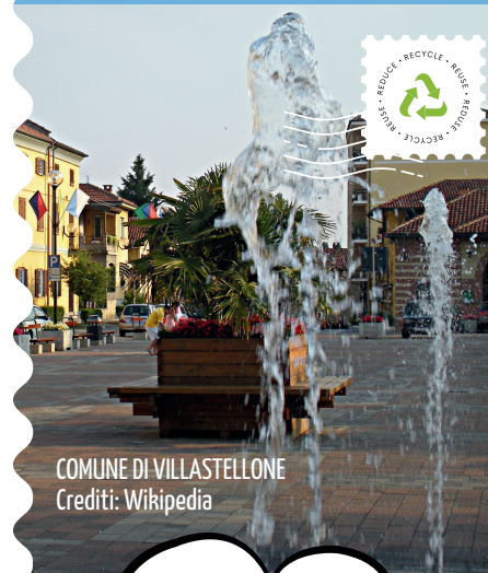
COMUNE DI VILLASTELLONE

PER MAGGIORI INFORMAZIONI CONSULTA "IL REGOLAMENTO DEI CENTRI DI RACCOLTA" SU WWW.COVAR14 O CHIAMA IL NUMERO VERDE CONSORTILE 800.639.639