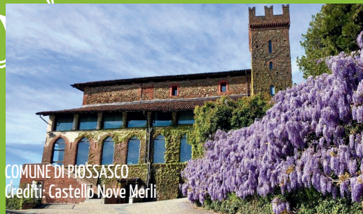
COMUNE DI PIOSASCO

UN NUOVO APPROCCIO ALL'ECONOMIA CIRCOLARE, PER RENDERE ANCORA PIÙ BELLE E PULITE LE NOSTRE CITTÀ!