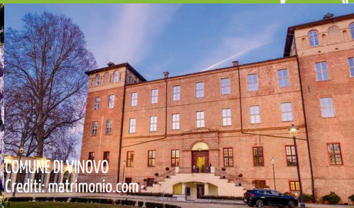
COMUNE DI VINOVO