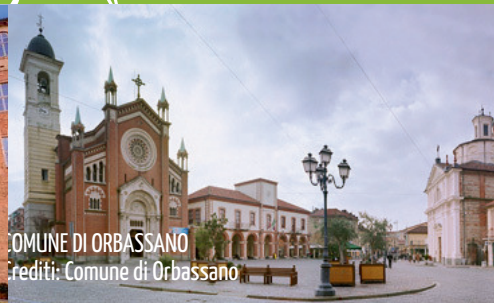
COMUNE DI ORBASSANO