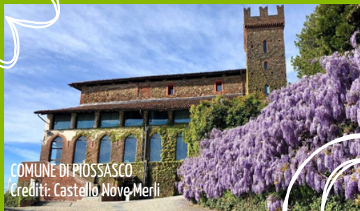
COMUNE DI PIOSSASCO

UN NUOVO APPROCCIO ALL'ECONOMIA CIRCOLARE, PER RENDERE ANCORA PIÙ BELLE E PULITE LE NOSTRE CITTÀ!