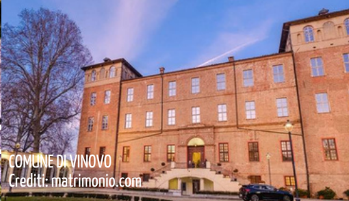
COMUNE DI VINOVO