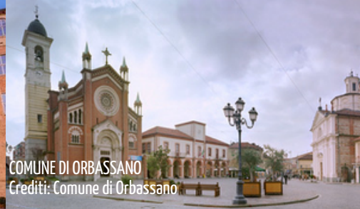
COMUNE DI ORBASSANO