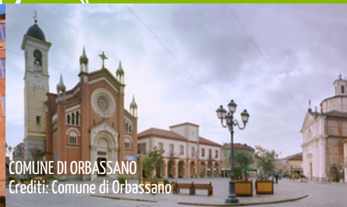
COMUNE DI ORBASSANO