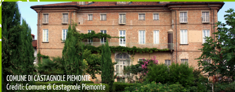
COMUNE DI CASTAGNOLE PIEMONTE