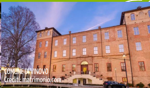
COMUNE DI VINOVO