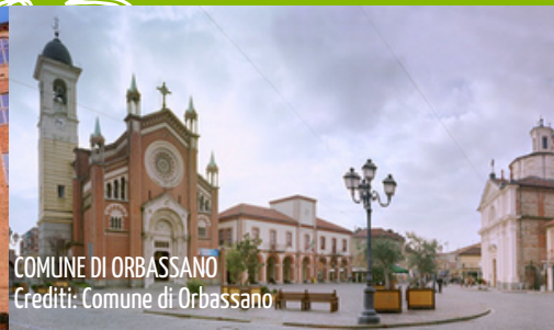
COMUNE DI ORBASSANO