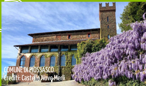
COMUNE DI PIOSSASCO Crediti: Castello Nove Merli

UN NUOVO APPROCCIO ALL'ECONOMIA CIRCOLARE, PER RENDERE ANCORA PIÙ BELLE E PULITE LE NOSTRE CITTÀ!