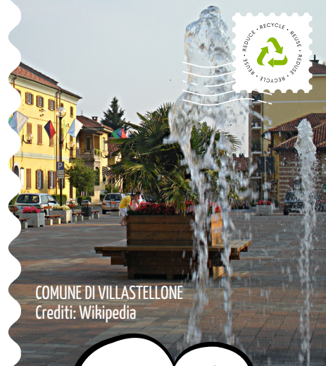
COMUNE DI VILLASTELLONE

PER MAGGIORI INFORMAZIONI CONSULTA "IL REGOLAMENTO DEI CENTRI DI RACCOLTA" SU WWW.COVAR14 O CHIAMA IL NUMERO VERDE CONSORTILE 800.639.639