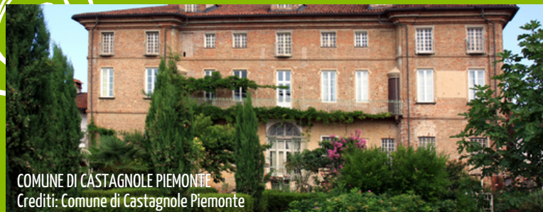
COMUNE DI CASTAGNOLE PIEMONTE