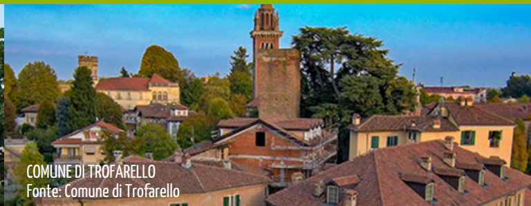
COMUNE DI TROFARELLO