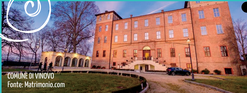
COMUNE DI VINOVO