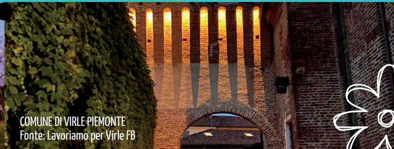
COMUNE DI VIRLE PIEMONTE