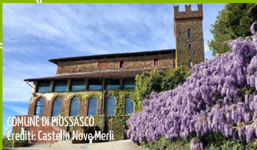
COMUNE DI PIOSSASCO

UN NUOVO APPROCCIO ALL'ECONOMIA CIRCOLARE, PER RENDERE ANCORA PIÙ BELLE E PULITE LE NOSTRE CITTÀ!