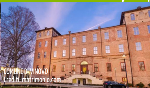
COMUNE DI VINOVO